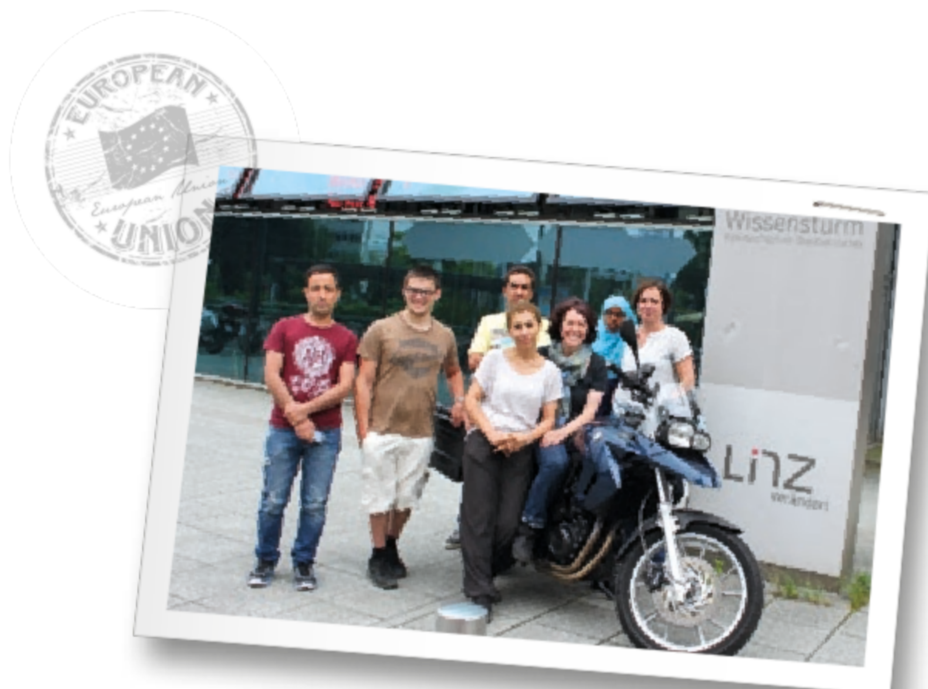
"Grundbildung on tour" von Martina Haas – Reise durch die österreichische Grundbildungslandschaft