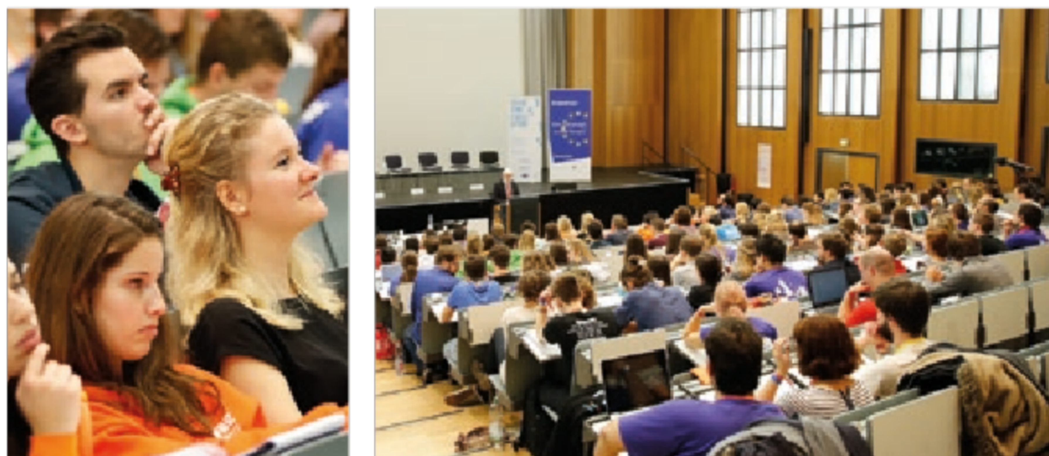
Teilnehmende einer Informationsveranstaltung zu Erasmus+ an der Universität zu Köln

Die strukturelle Internationalisierung (Marketing, Kooperationen etc.) wird durch inhaltliche (internationale, teils gemeinsame Lehrpläne) und personelle (Studierenden- und Personalmobilität) Internationalisierung von Lehre und Forschung mit Leben gefüllt. Für die (noch) nicht mobilen Lernenden greifen die Maßnahmen der Hochschulen in der Internationalization@Home .