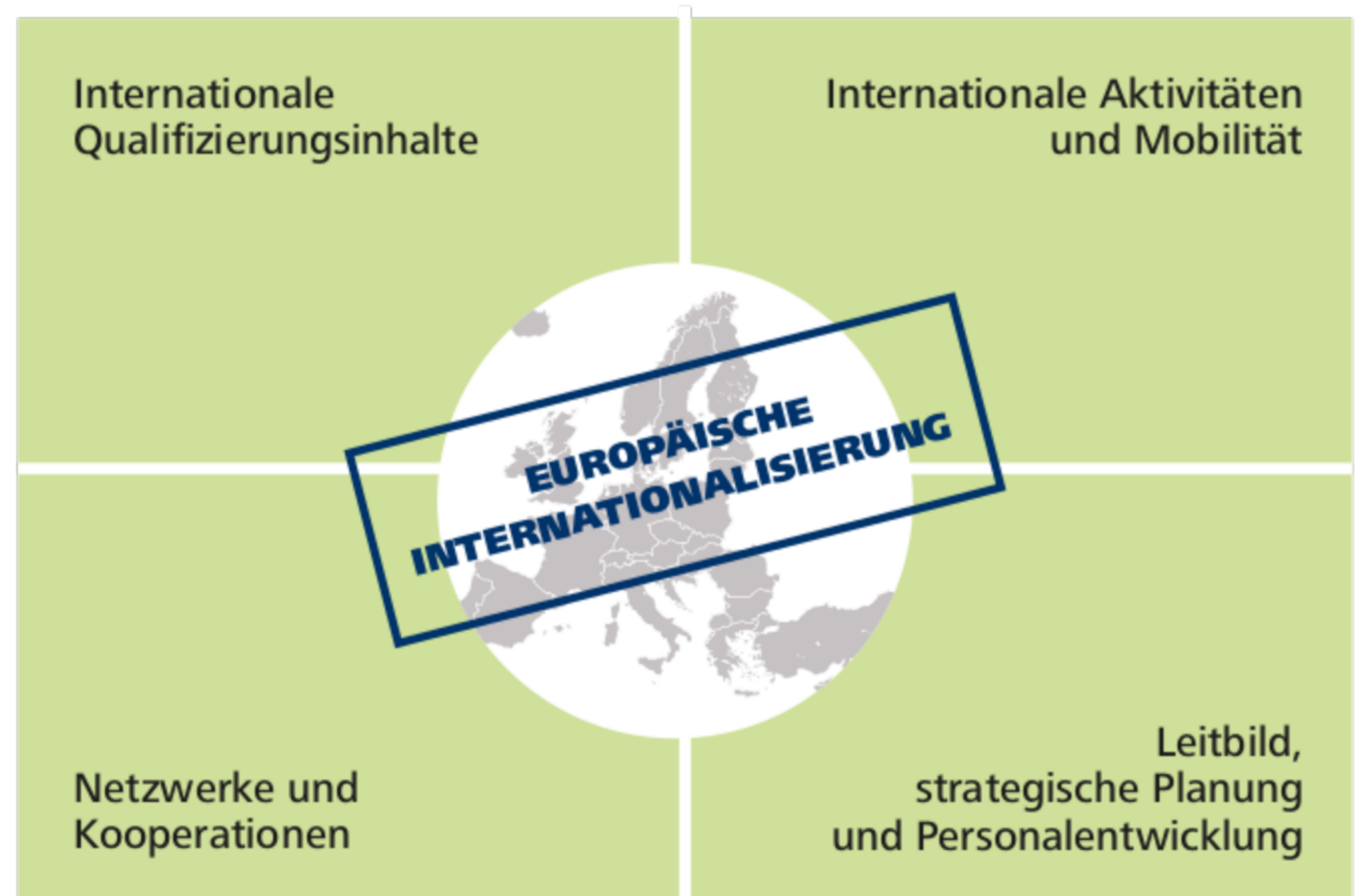
Vier relevante Bereiche für die Erarbeitung einer Internationalisierungsstrategie