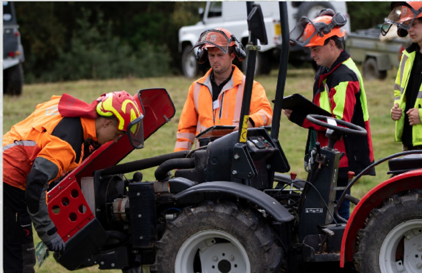
Prüfungssituationen: Wartung einer Kleinstmaschine (links) Beladung eines Anhängers (rechts)