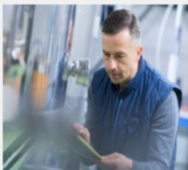
Internationalisierung der Berufsbildung