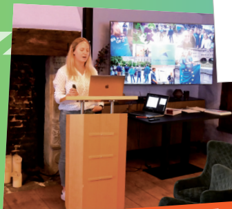
Seminare und Workshops