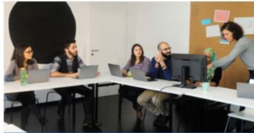
„Selbst erleben ist anders als Theorie“