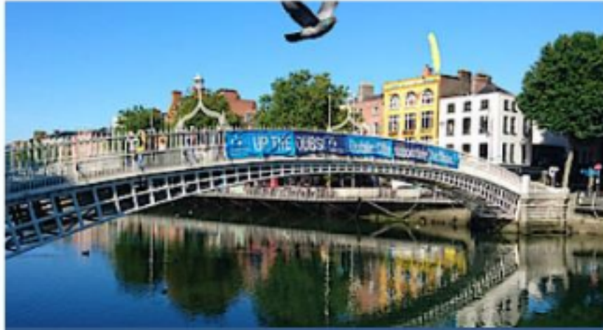
Alphabetisierung: Ideen aus Dublin